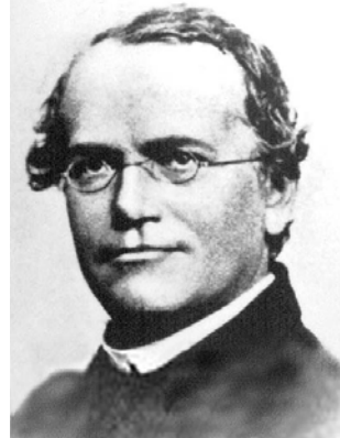
চার্লস রবার্ট ডারউইন, গ্রেগর মেডেল

যদিও প্রকৃতিবিদ ডারউইন ও সুপ্রজননবিদ্যা (জেনেটিক্স) এর জনক গ্রেগর মেডেল সমসাময়িক ছিলেন তবে মেডেলের প্রজননবিদ্যার সূত্রগুলো ডারউইনের সম্ভবত জানার কথা নয় এই জন্যে যে মেডেলের সূত্রগুলো ১৮৬৫ সনে জার্মান ভাষায় প্রকাশিত হয়েছিল। গ্রেগর মেডেল তাঁর বৈজ্ঞানিক পরীক্ষানিরীক্ষা করেছিলেন মটরসূটি শস্য নিয়ে আবার অন্যদিকে ডারউইন প্রকৃতিবিদ হিসেবে বুক পড়েছিলেন প্রাণীকূলের দিকে। মেডেল তাঁর দৃষ্টি নিবদ্ধ করেছিলেন ‘জিনস্’ এর দিকে আর ডারউইন দেখছিলেন কি ভাবে ‘স্পিসিয়েশন’ বা ‘স্পিসিজ’ এর ক্রম-বিবর্তন হয় যেমন একপ্রকারের ফিঞ্চ পাখী অন্যপ্রকারের ফিঞ্চ পাখী থেকে আলাদা হয়ে এক নতুন স্পিসিজে পরিণত হয় এ’সব নিয়ে তিনি চিন্তা ভাবনা করতেন। তথ্যগত দিক থেকে মেডেল ছিলেন ‘মাইক্রো’ বা সূক্ষ্ম তথ্যের অনুরাগী আর ডারউইন ছিলেন ‘মেক্রো’ বা মোটা (বা পুরো) তথ্যের অনুসন্ধানী। এই দুই মহামানুষ সত্যের অনুসন্ধান মগ্ন ছিলেন ঊনবিংশ শতাব্দীর মাঝামাঝিতে যদিও মেডেল ছিলেন চার্চের যাজক আর ডারউইন ভেবেছিলেন ধর্মশাস্ত্র নিয়ে তিনি ক্যামব্রিজে স্নাতক লাভ করবেন। এই দুই মনীষীর জ্ঞানার্জনে জীববিদ্যার সম্প্রসারণ ঘটলো পুরো বিংশ শতাব্দী ধরে। আজ যে ‘হিউম্যান জিনম’ নিয়ে এত গবেষণা হচ্ছে সারা পৃথিবীর বৈজ্ঞানিক মহলে সেটাও কিন্তু মেডেলের ‘জেনেটিক্স’ ও ডারউইনের অভিব্যক্তি বা